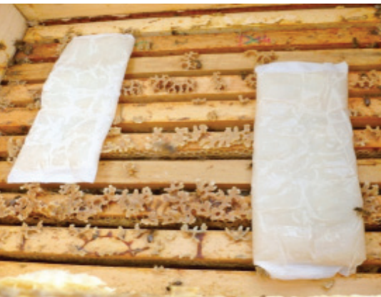
Aufgelegte MAQS ® -Streifen – durch die AS-Ausdunstung weichen die Bienen zurück.

S echs Varroazide stehen deutschen Imkern momentan zur Verfügung, um die Milbe zu bekämpfen. Bayvarol, Perizin und Thymolpräparate sind fettliebend und verursachen bei Dauer- sowie Fehlanwendungen Rückstände in Bienenprodukten. Milchsäure, Ameisensäure und Oxalsäure hingegen sind wasserliebend. Wendet man sie nach der letzten Schleuderung und mit ausreichend Abstand vor der nächsten Tracht an, bleibt Honig rückstandsfrei. Wie verhält es sich aber, wenn Ameisensäure (AS) während der Tracht angewendet wird?