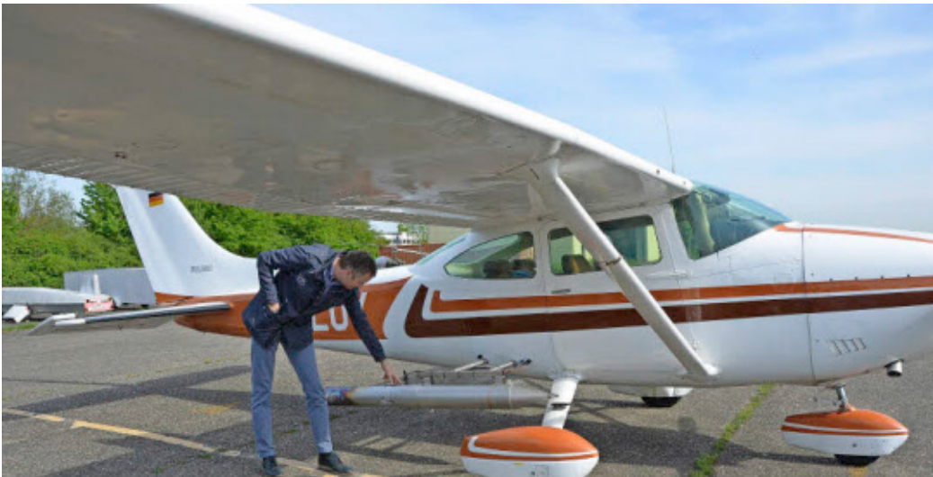
Zu 14 Einsätzen ist der Ortenauer Hagelflieger im vergangenen Jahr aufgestiegen.