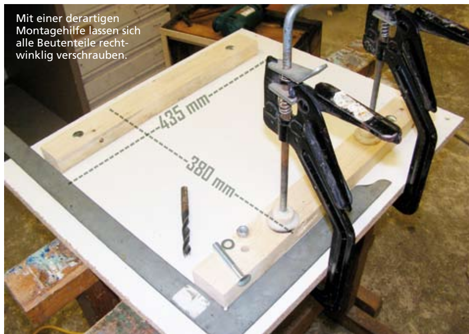
Mit einer derartigen Montagehilfe lassen sich alle Beutenteile rechtwinklig verschrauben.